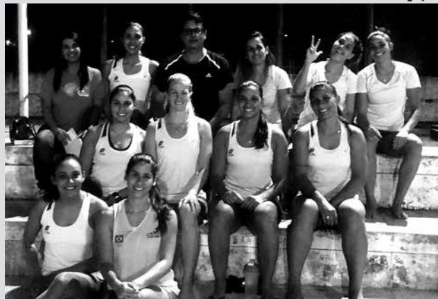
Atletas vão treinar no Estado a partir do próximo dia 20