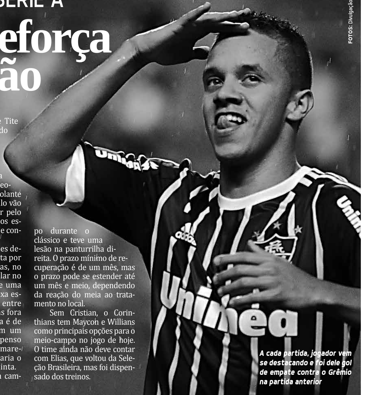
A cada partida, jogador vem se destacando e foi dele gol de empate contra o Grêmio na partida anterior