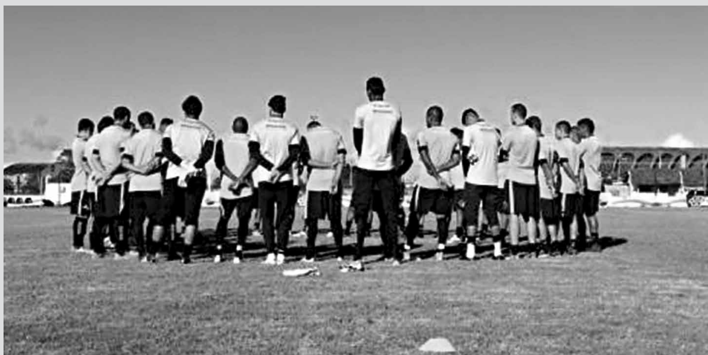
Time pessoense já deixou de lado o confronto final de ontem pelo Paraibano 2016 e pretende continuar fazendo bonito