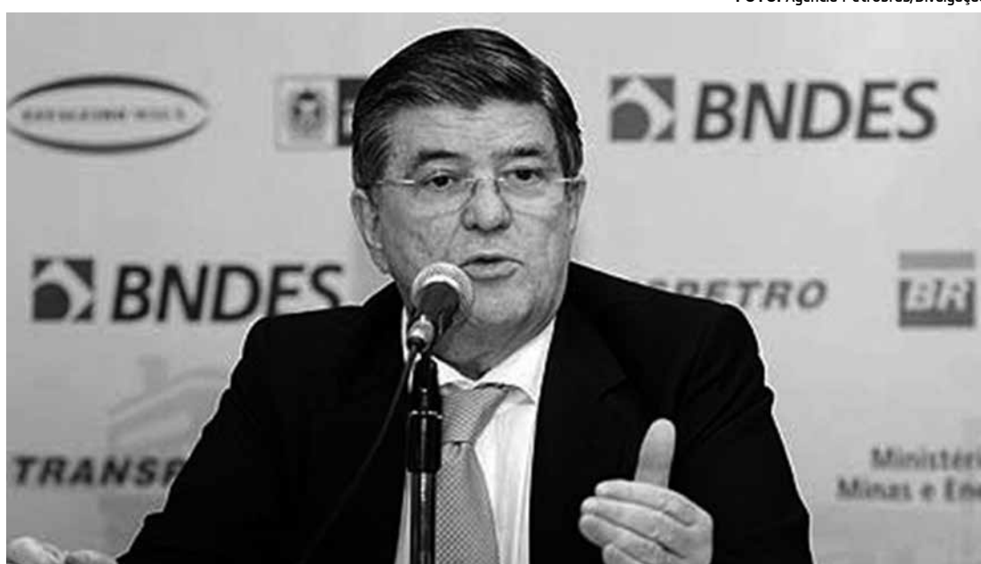
Na delação, o ex-presidente da Transpetro, Sérgio Machado, comprometeu vários políticos

é oriundo de pagamento de vantagem indevida pela Queiroz Galvão, de contratos que ela possuía junto a Transpetro; que o depoente ligou para Michel Temer e avisou que a contribuição ocorreria", diz o documento.