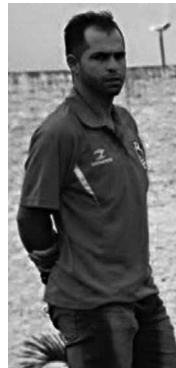
Treinador está muito otimista

América e Sousa está programado para o próximo domingo, às 16 horas, no Estádio Ademir Cunha, em Paulista, interior pernambucano. A CBF já definiu o trio de arbitragem para esta partida. O árbitro central será o sergipano Diego da Silva, auxiliado por Marcelino Castro de Nazaré e Gilberto Freire de Farias, ambos pernambucanos.