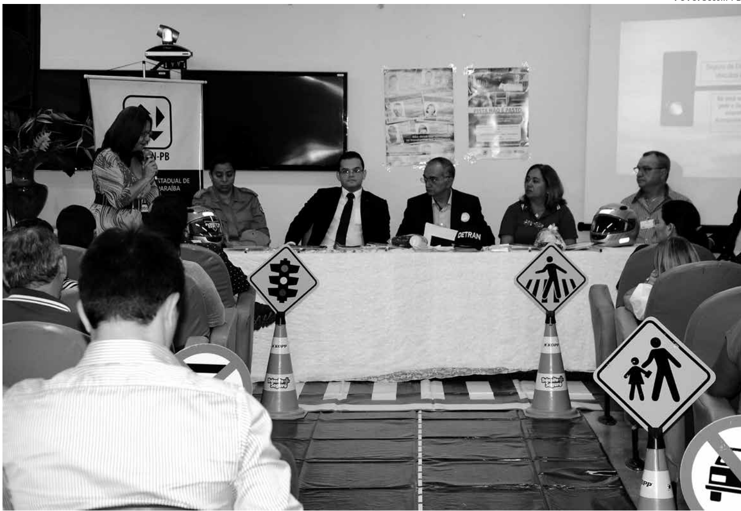
Lançamento da campanha aconteceu ontem, no auditório do Hospital de Emergência e Trauma Senador Humberto Lucena, na capital

A campanha recém-lançada pelo Detran alcançará todo o Estado, com o obje-