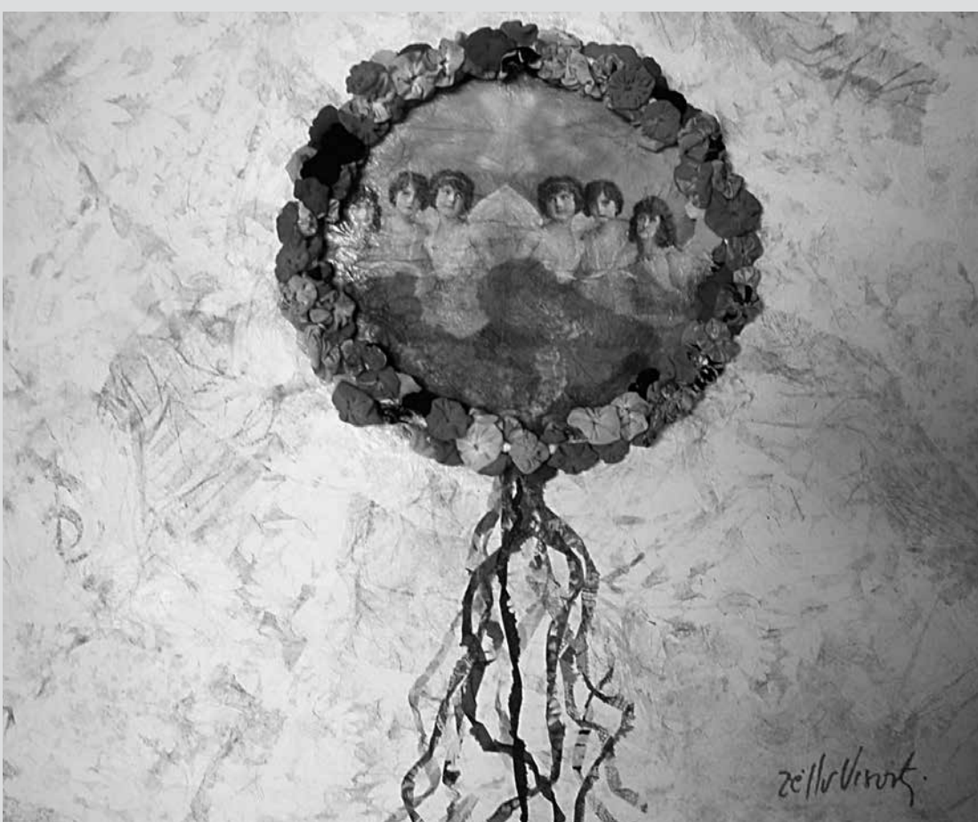
Um dos trabalhos feitos com a técnica de aplicação de papel, cola e guardanapos decorativos