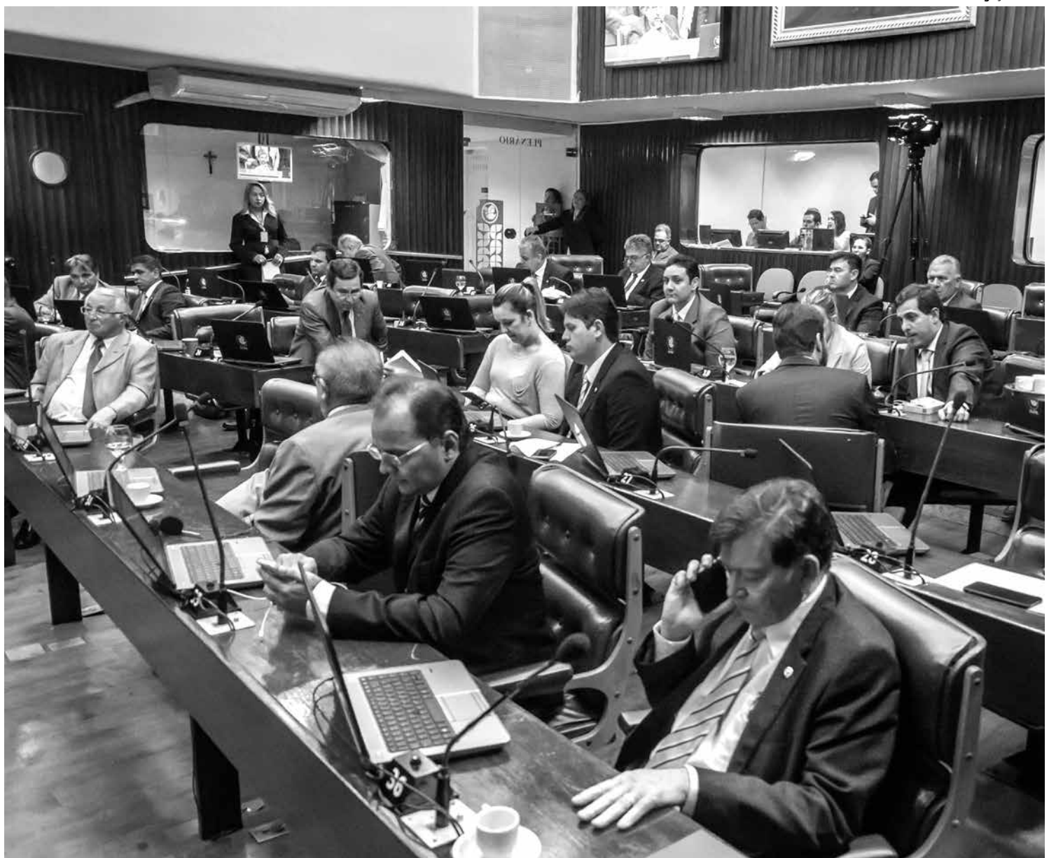
Além da LDO, deputados aprovaram 253 matérias, entre as quais Projetos de Lei, de Resolução, Medida Provisória e Requerimentos

Desde 2011, o Governo do Estado realiza investimentos para promover a melhoria da qualidade de vida da população de Mangabeira, destacando-se Programa Cidade Madura, Escola Técnica, Trevo das Mangabeiras, Restaurante Popular, Distrito Integrado de Segurança Pública, Unidade de Polícia Solidária, Centro Socioeducativo (Fundac) e Centro de Formação de Professores (em construção).