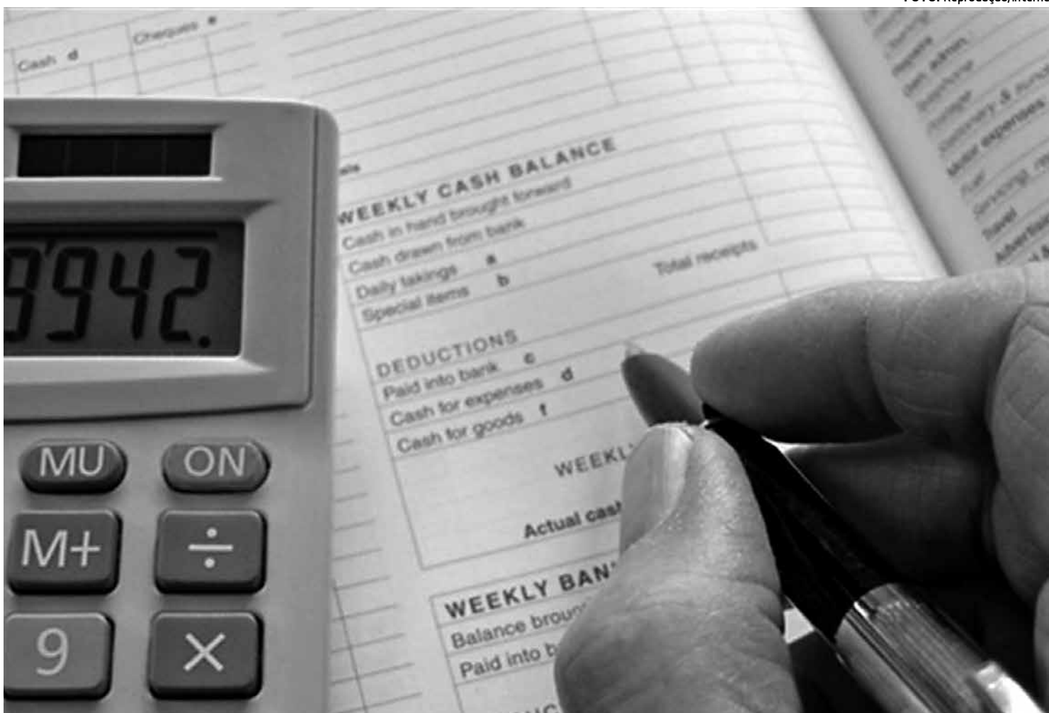
Declaração retificadora pode solucionar problema identificado na declaração de Imposto de Renda, conforme orienta a Receita Federal

Se o contribuinte tiver dúvida sobre a situação da declaração poderá consultar o Serviço Virtual de Atendimento (e-CAC) na página da Receita, onde é possível acessar o extrato da declaração e ver se há inconsistências de dados identificadas pelo processamento. No caso de identifica-