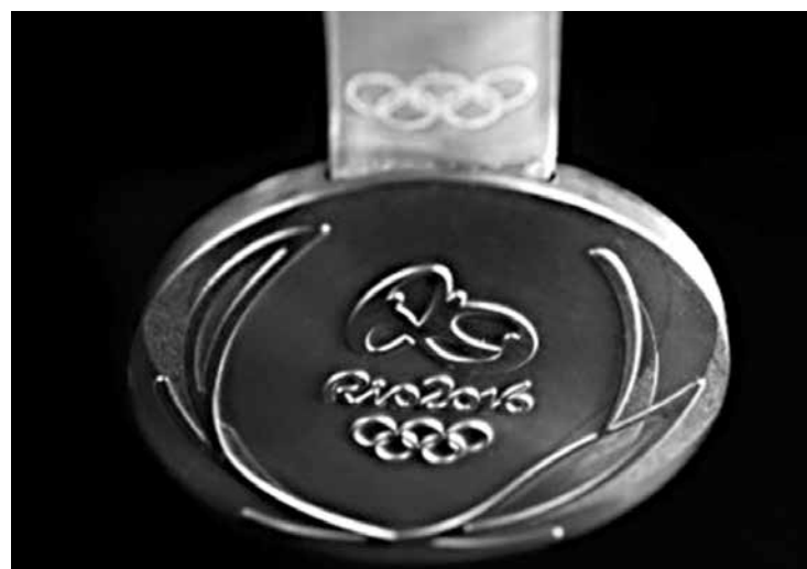
A Casa da Moeda produziu 5.130 medalhas para premiação

Além das premiações, o Comitê apresentou ainda o pódio dos Jogos, também feito com material reciclável.