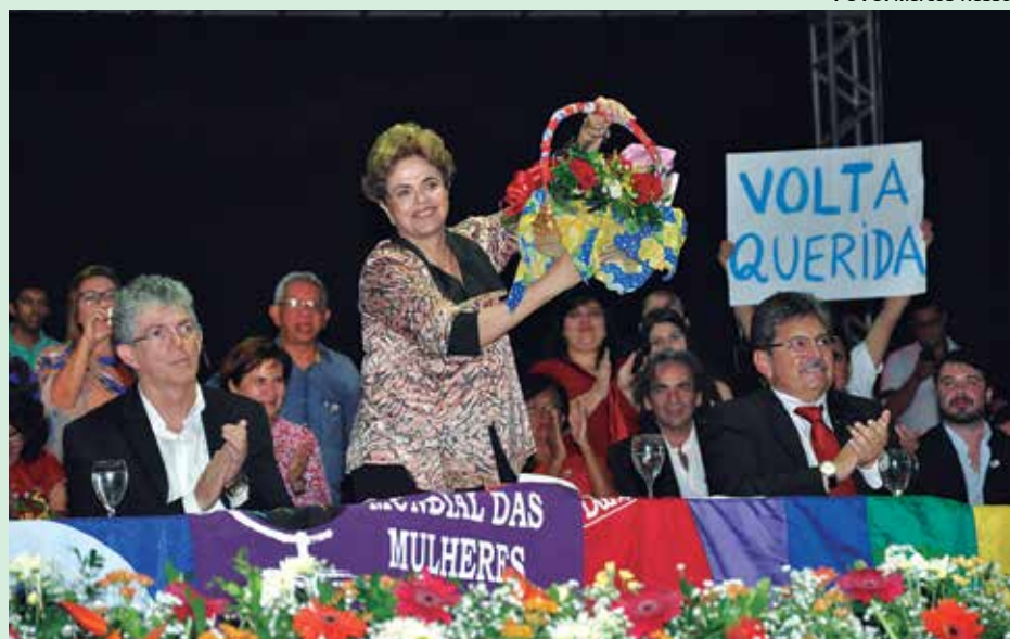
Presidente Dilma Rousseff recebeu diversas homenagens dos participantes