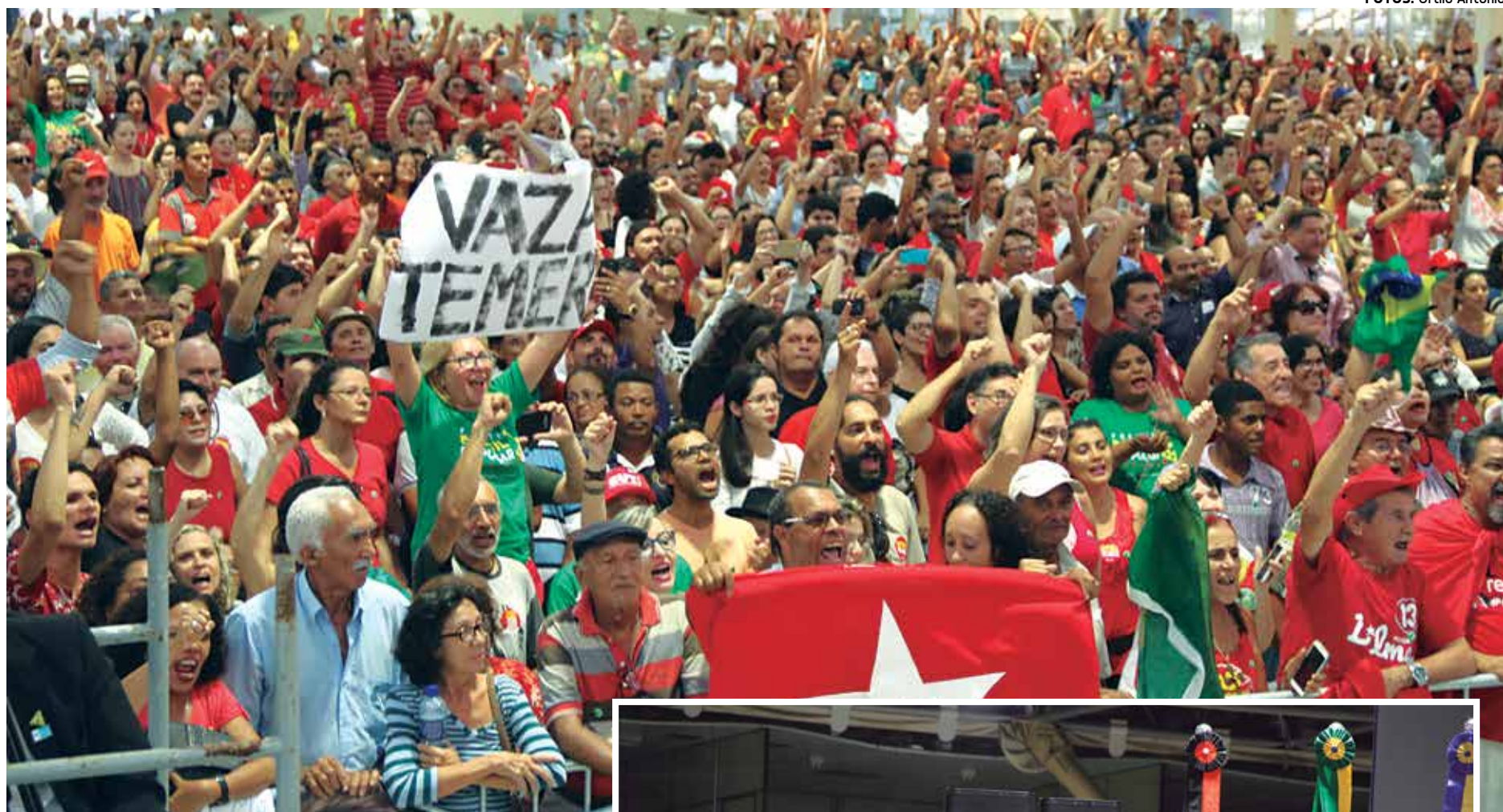
Audiência Pública promovida pela Assembleia Legislativa debateu o golpe contra a democracia e o momento político brasileiro

A solenidade começou com o Hino Nacional executado por uma banda formado por crianças e adolescentes do Projeto Prima. A Praça do Povo do Espaço Cultural ficou lotada por representantes do povo, entidades de classe, agricultores que chegaram de