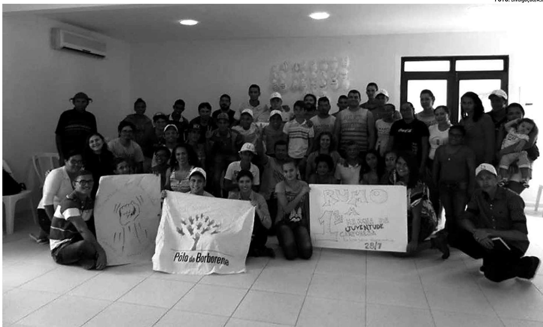
Valorização do jovem na agricultura familiar e o seu conhecimento também se insere na programação do Primeiro Encontro da Juventude Camponesa

Estarão presentes mais de 150 jovens dos 14 municípios onde o Polo da Borborema atua. A programação terá início às 14h da sexta-feira, dia 17, com uma mística sobre o tema: "Valorização do Jovem na Agricultura Familiar e de seu conhecimento". Em seguida haverá a mesa constituída integralmente pelos jovens, intitulada "Juventude do Polo da Borborema". Na ocasião, serão apresentados os principais resultados do Diagnóstico da Juventude Rural, organizados em três grandes temas: educação formal, acesso a recursos na-