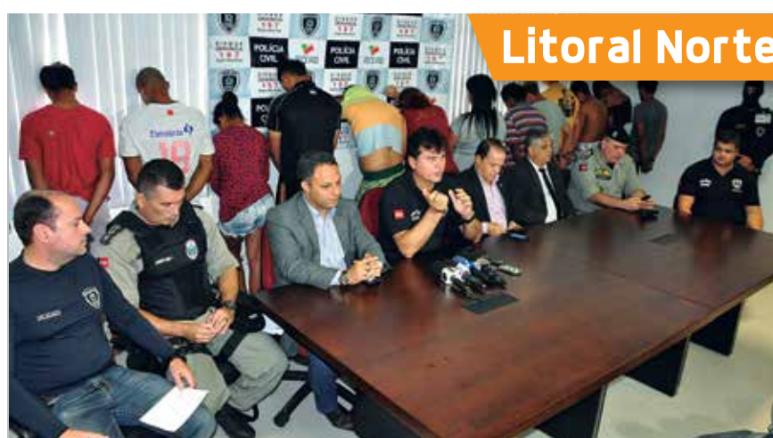
Polícias Civil e Militar deram entrevista coletiva para detalhar a ação

Grupo é suspeito de tráfico de drogas e participação em homicídios na região do Vale do Mamanguape e Baía da Traição. PÁGINA 5