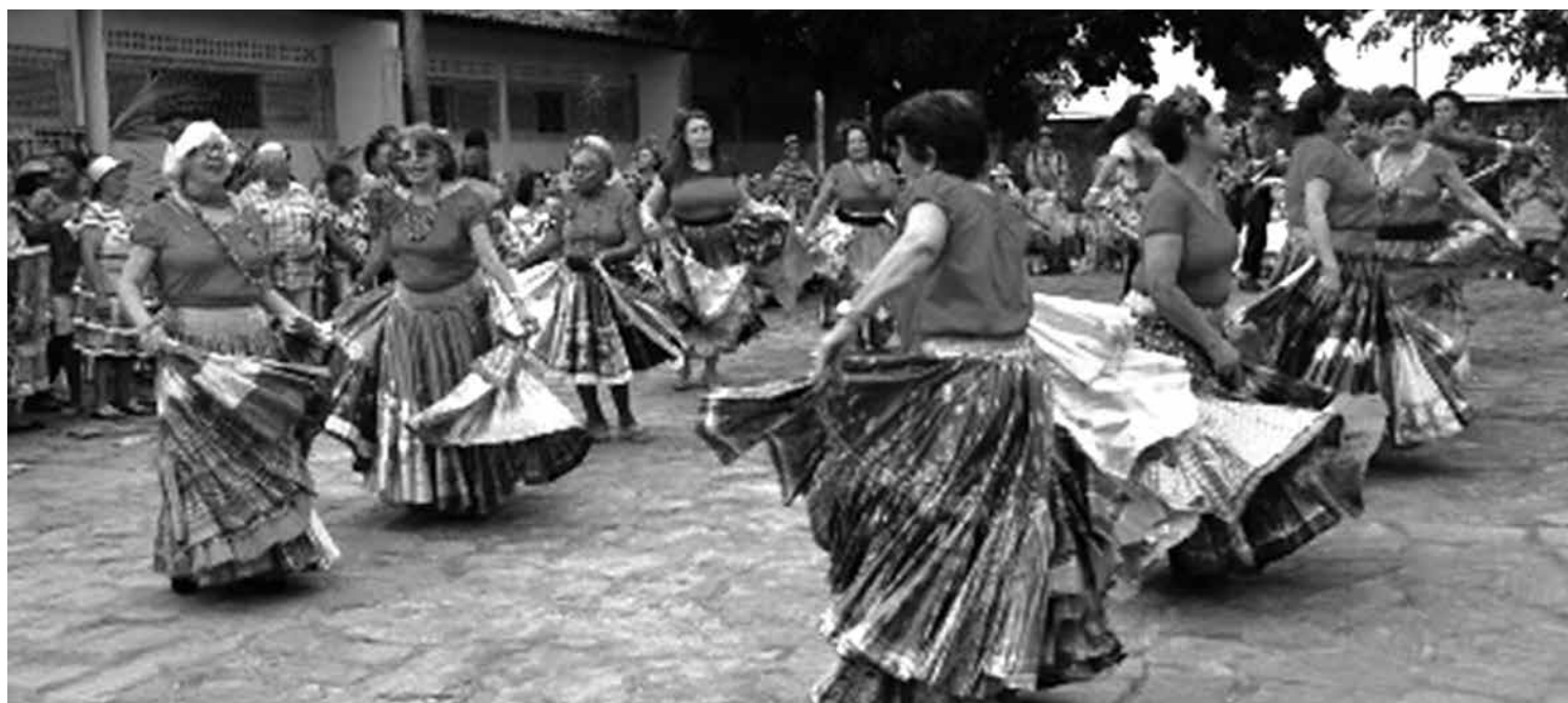
O brilho da festa ficou mesmo por conta dos próprios grupos de idosos que realizaram apresentações de várias quadrilhas

A comemoração contou com dois momentos, um dentro do CSU do Rangel e outro na frente do prédio, para poder acomodar melhor a todos que participaram do evento.