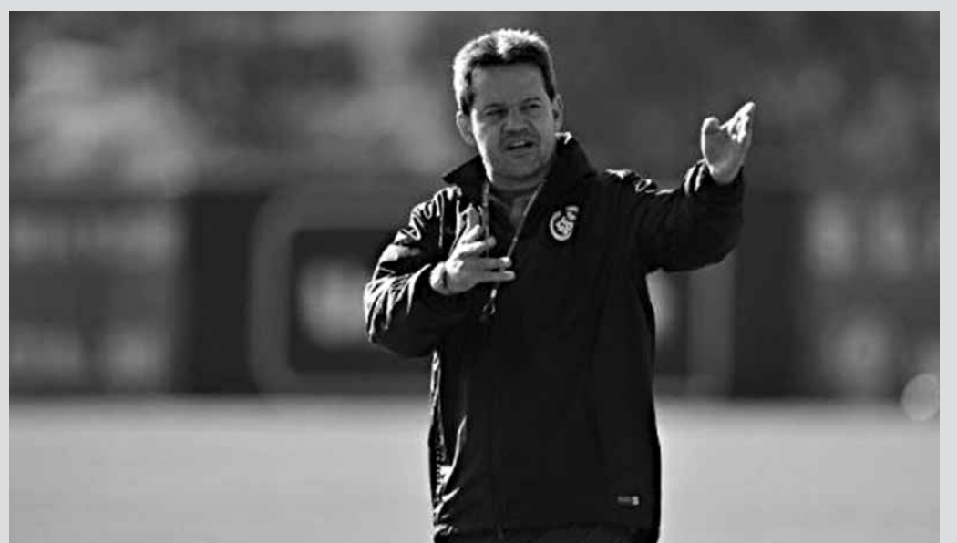
Com várias opções de jogadores, o treinador terá "dor de cabeça" para escalar a equipe